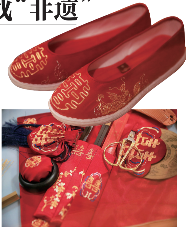
金银彩绣用在了婚庆用品上更显喜庆。