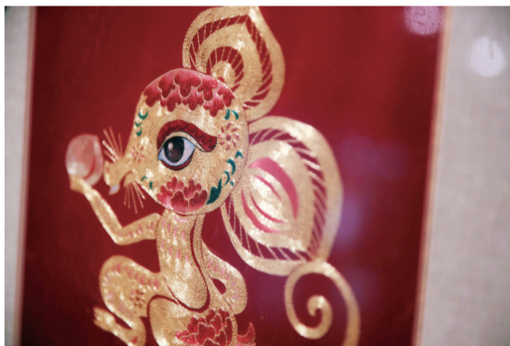
金银彩绣制作的鼠年生肖装饰品。