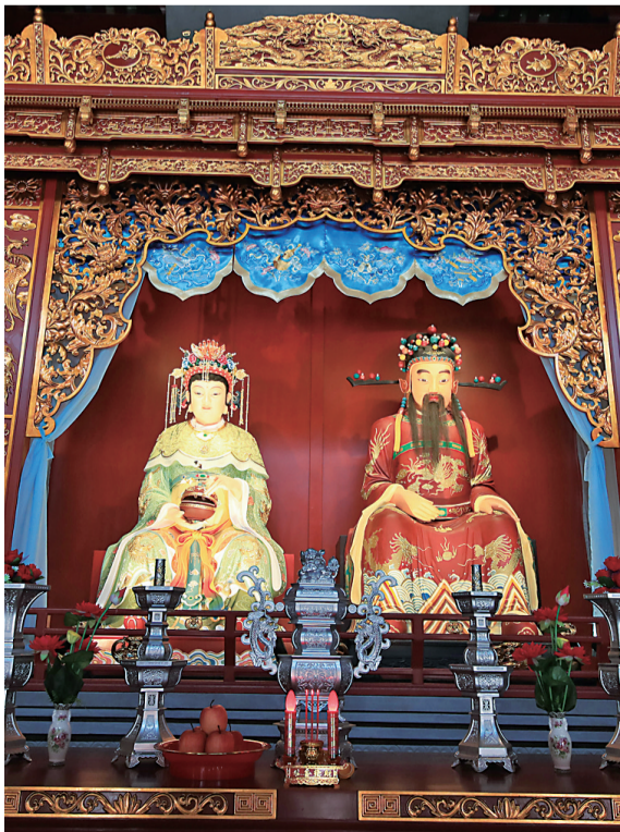
宁波城隍庙里塑像上用到的金银彩绣垂帷。