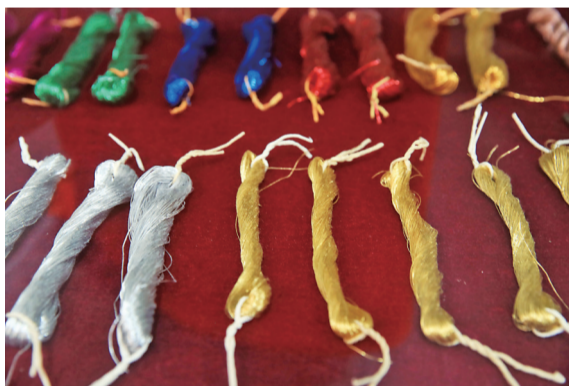
金银彩绣用到的各类线。