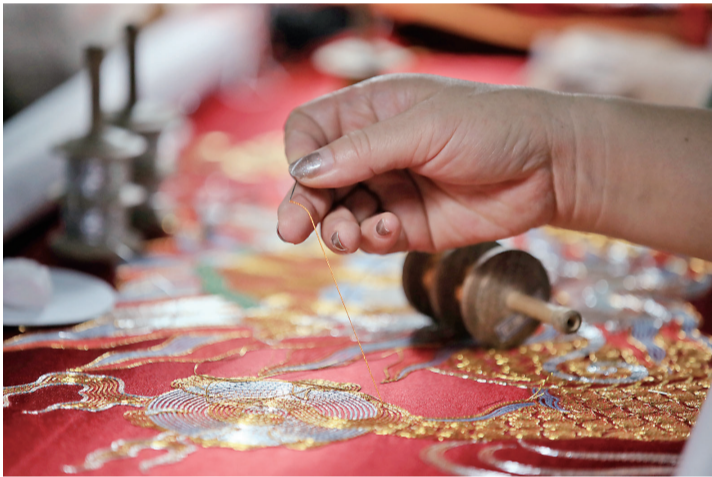
一针一线中,华丽的金银彩绣作品慢慢成形。