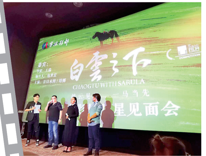
《白云之下》主创在甬路演。