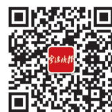
宁波晚报官方微信