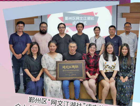
鄞州区“网文江湖社”成立仪式上众人合影。