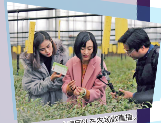
小麦团队在农场做直播。