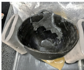
可能是世界上最早的木碗。

这是一件组合器,手柄是木器,顶上有凹槽,正好嵌入打磨过的石块。单面刃的石铤、平面的石锤都可以。如此一斧砍下去,因为受力面是石头,工具效能大大增强。