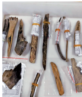
骨器家族。