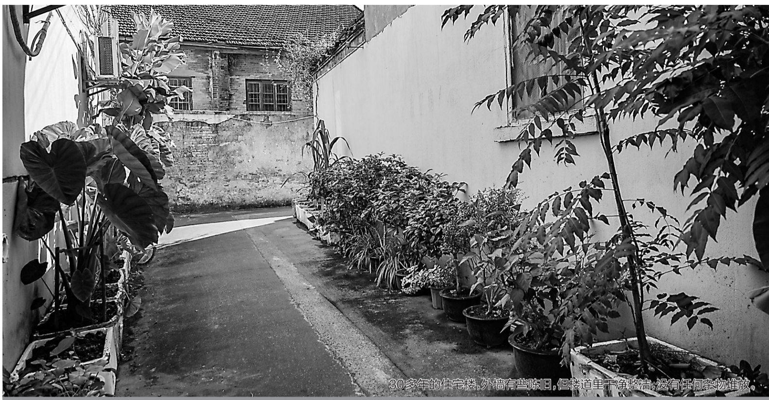
30多年的住宅楼,外墙有些陈旧,但楼道里干净整洁,没有任何杂物堆放。