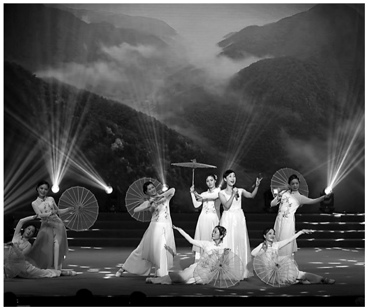
余姚陆埠镇兰山村村民在表演村歌。

你们的村歌村舞背后，有着怎样的动人故事？欢迎大家爆料，为你们家乡的村歌村舞打Call。