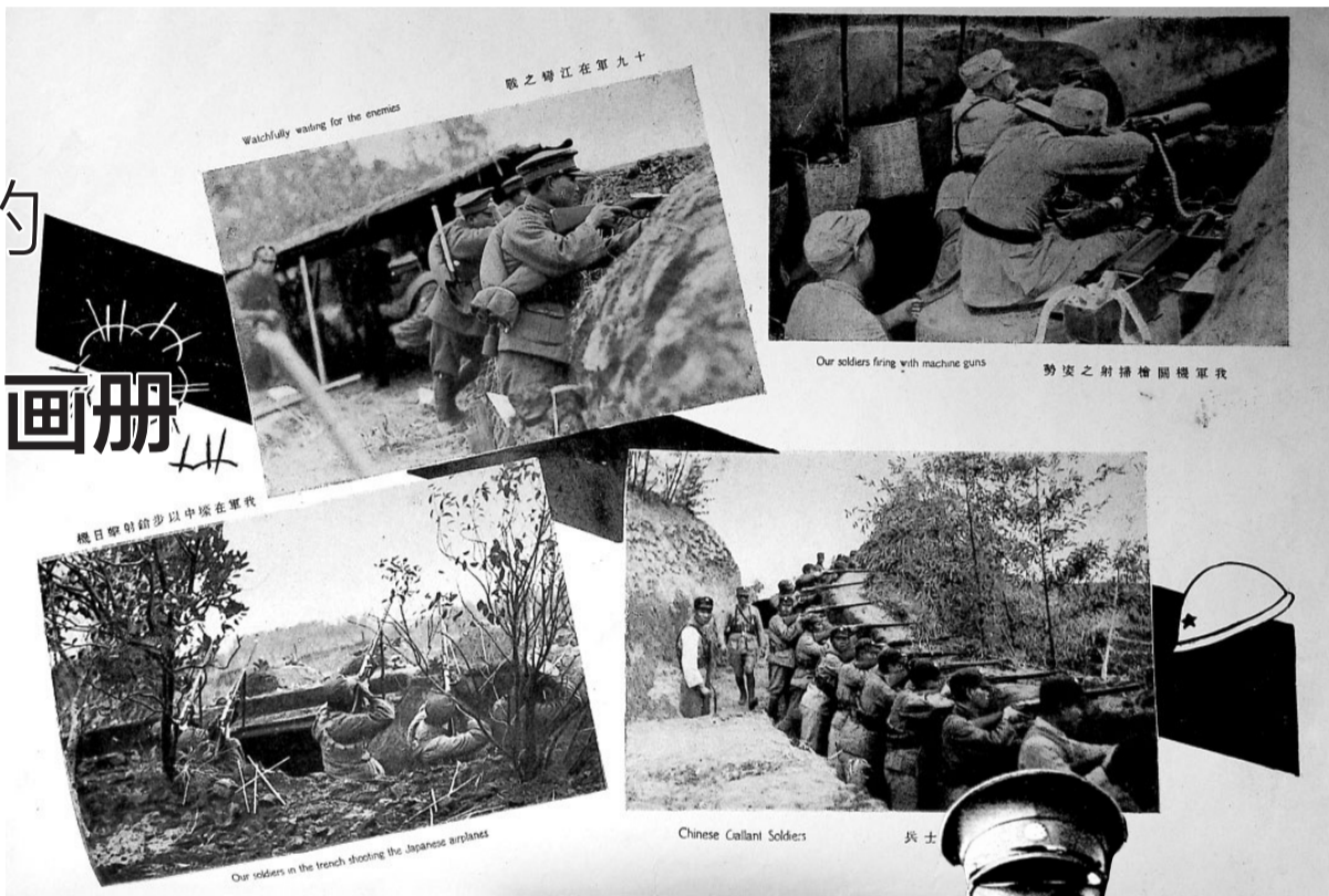
《淞沪御日血战大画史》收录的照片