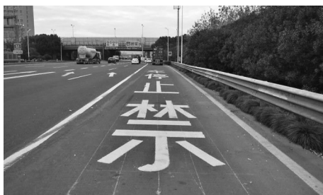
双向施划黄色禁停线，车辆违停将记3分。