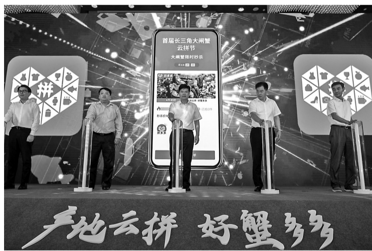
首届长三角大闸蟹云拼节启动现场。

9月16日,在长三角区域合作办公室及沪苏浙皖一市三省农业主管部门的共同指导下,首届长三角大闸蟹云拼节在上海开幕。在开幕仪式上,太湖、固城湖、洪泽湖、长荡湖、高邮湖、大纵湖、南漪湖、芜湖、兴化等长三角大闸蟹优质产区联合拼多多,共同成立“长三角大闸蟹云拼优品联盟”,推动长三角大闸蟹产业实现一体化、高质量发展。