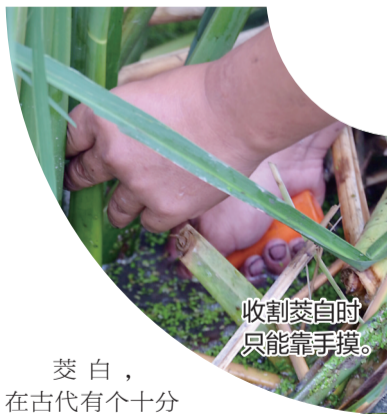
收割茭白时只能靠手摸。