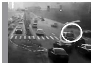
老人过马路，车辆自觉让行。