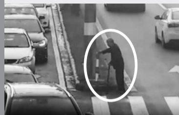
老人走到中心绿化带休息。