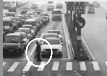
海曙交警指挥中心延长绿灯时间。