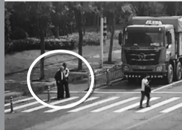
老人再次出现，铁骑队员上前搀扶。