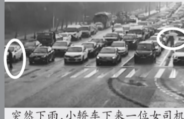
突然下雨，小轿车下来一位女司机。