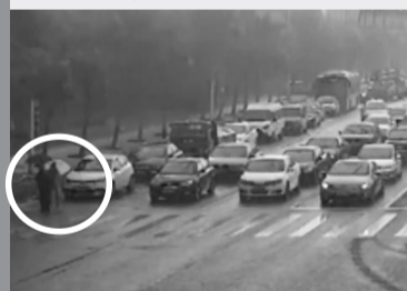
女司机快步跑上前，将雨伞递给老人。