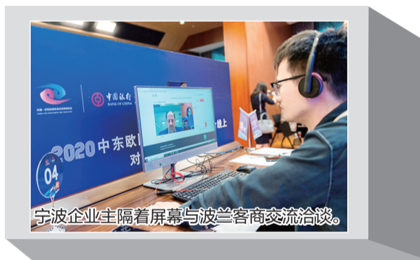
宁波企业主隔着屏幕与波兰客商交流洽谈。