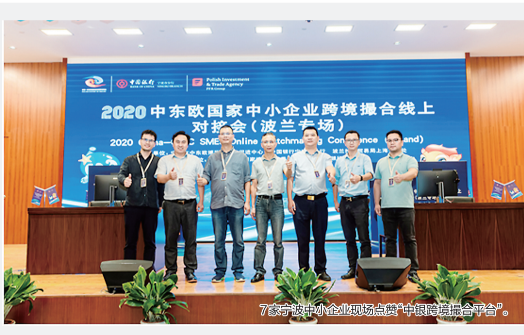
7家宁波中小企业现场点赞“中银跨境撮合平台”。

银行牵线搭桥,远在千里之外,却能“面对面”洽谈,还贴心配备同声翻译……9月28日下午,一场由宁波市中东欧博览与合作促进中心、中国银行宁波市分行和波兰投资贸易局上海代表处主办的中东欧国家中小企业跨境撮合线上对接会(波兰专场)在中银跨境撮合平台成功举办。此举不仅为甬城的中小企业带来了新的合作机会,也为波兰当地企业送去了商机。