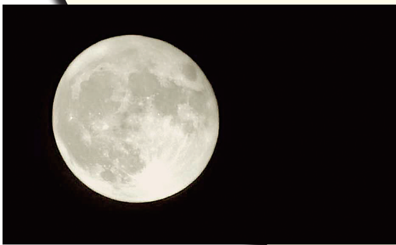
记者在航班上拍摄的月亮。