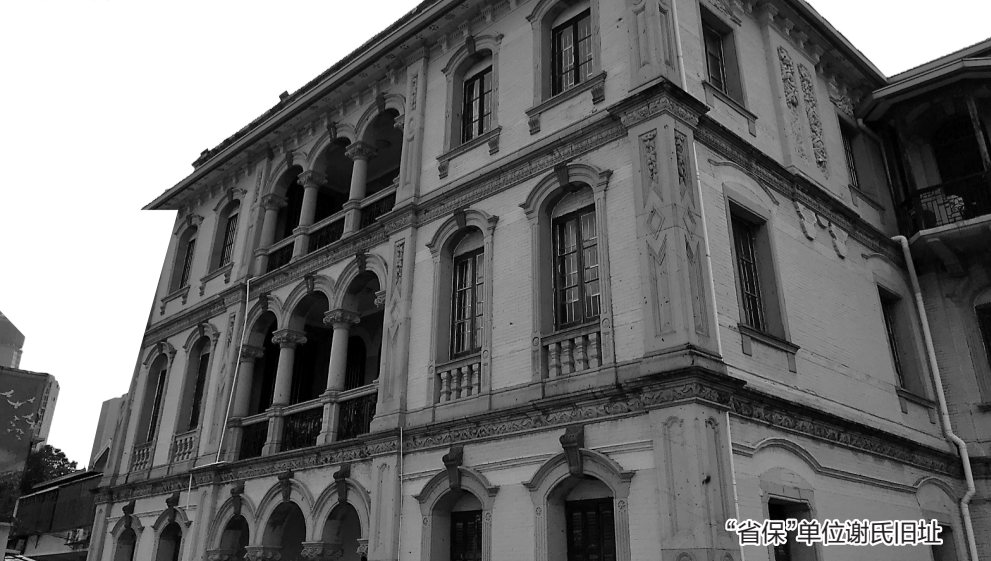
“省保”单位谢氏旧址