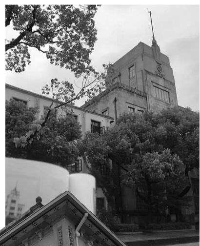
中国通商银行宁波分行旧址