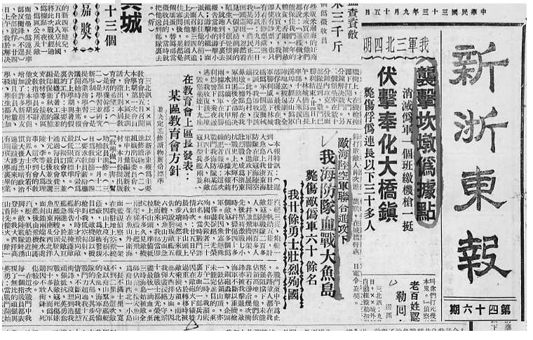
1944年9月15日《新浙东报》报道大鱼山岛战斗