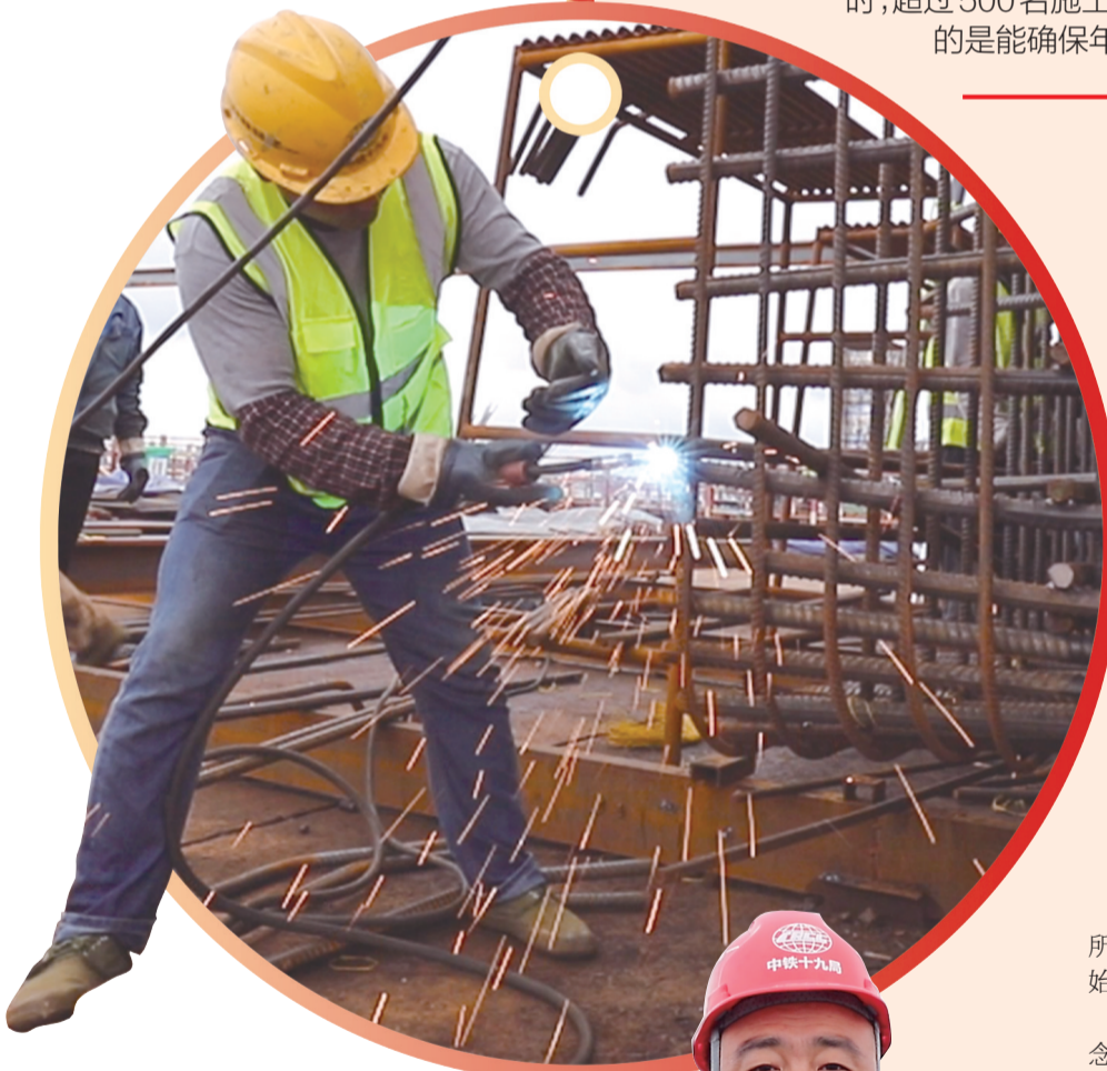
工人正在紧张施工。

这个长假，杭甬高速复线宁波一期工程S2合同段施工现场一派热火朝天：在镇海外海空旷的洋面上，刚搭建完的海上施工平台和栈道，就像一条蜿蜒在海上的钢铁巨龙，一眼望不到头。昨天下午，记者来到这里时，超过500名施工人员坚守海上施工一线，他们主动放弃休假，为的是能确保年底前完成海域施工的各项既定目标。