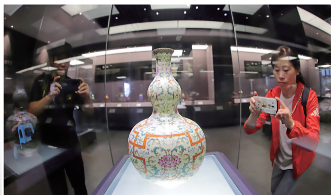
瓯江彩艺术博物馆

9月28日上午，2020长三角媒体温州行暨“大建大美”摄影大赛开启。来自长三角地区30多家媒体的摄影记者聚首温州，共同探访长三角“南大门”城市的美丽新颜。