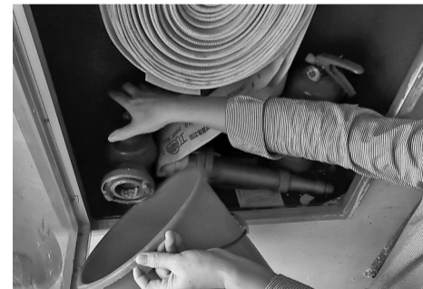
居民打开消火栓的龙头,里面滴水皆无。

防部门,消防部门表示近期将进行实地调查。相关业内人士透露,楼道内的消火栓也分干式和湿式,其中干式就是平时配水管网里无水的,至于该小区究竟为何种消火栓,尚有待调查。另据记者了解,如果小区存在明显的消防安全隐患,消防部门将责令物业等相关主管部门予以整改。