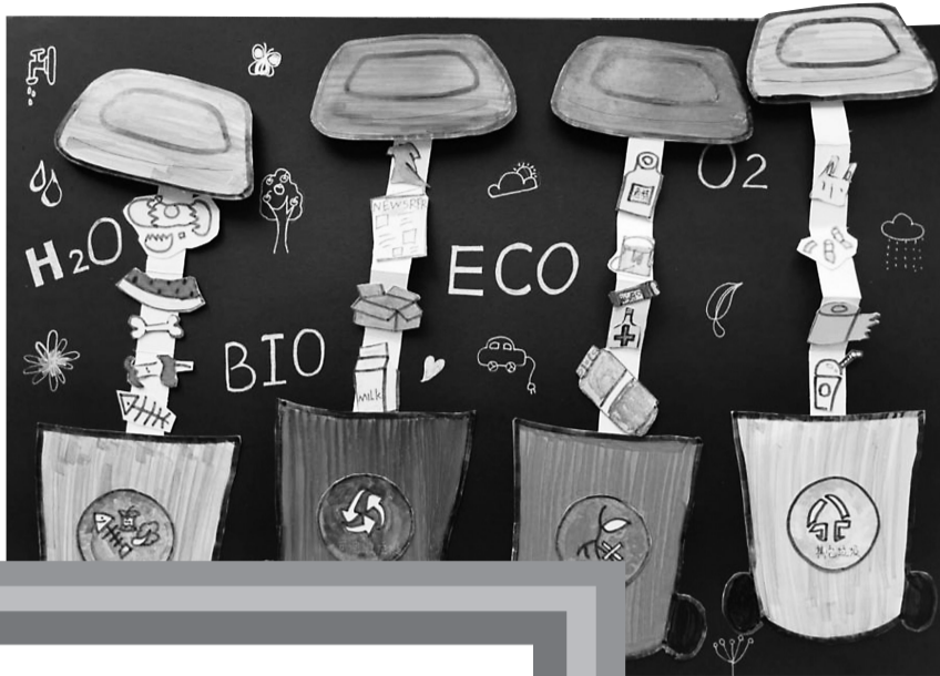
垃圾分类你我行 鄞州蓝青小学 201班 励梓涵(证号2020961) 指导老师 陈维娜

我们每天都会遇到各种有趣的事：写作业时偷玩手机被妈妈发现了，只得承认错误；夜晚的植物园美轮美奂，小记者走进“时光隧道”，感觉犹如在仙境里腾云驾雾；经典游戏击鼓传花永远不会过时，任何时候玩起来，都可以让大家哈哈大笑……如果你是一个有心人，把那些趣事记录下来，告诉大家吧！