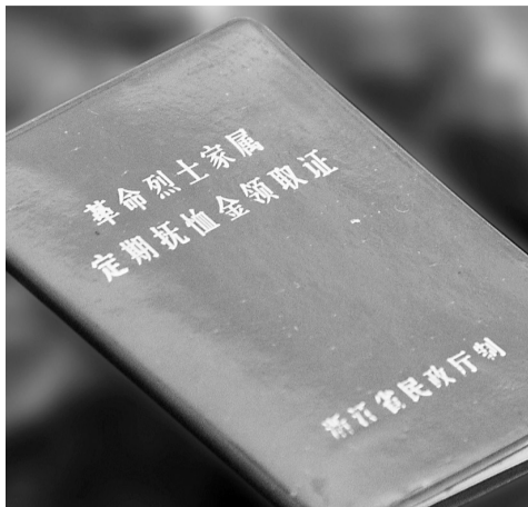
沈家保存的革命烈士家属定期抚恤金领取证。