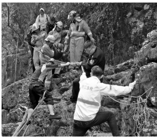
救援人员艰难地把被马蜂蜇伤的驴友转移下山。

据了解,为了营救一名被马蜂蜇伤的驴友,当地民警、消防、医护人员肩扛背负“无所不用其极”,在前后3小时的时间里,在山林间几乎耗尽体力,将伤者营救下山。