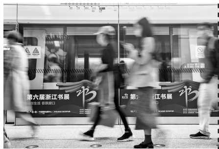
书展的氛围已非常浓郁。