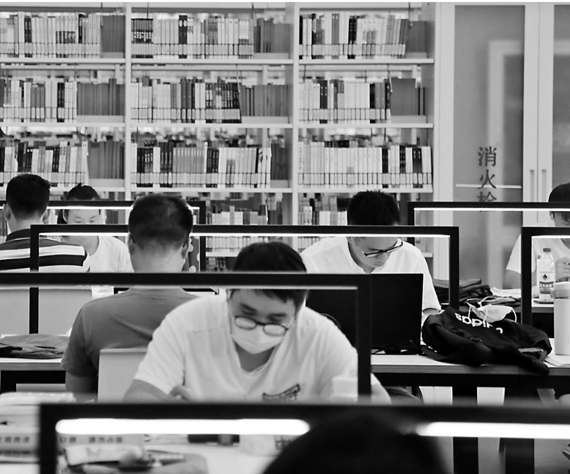
宁波市全省首个以立法形式促进全民阅读的城市。