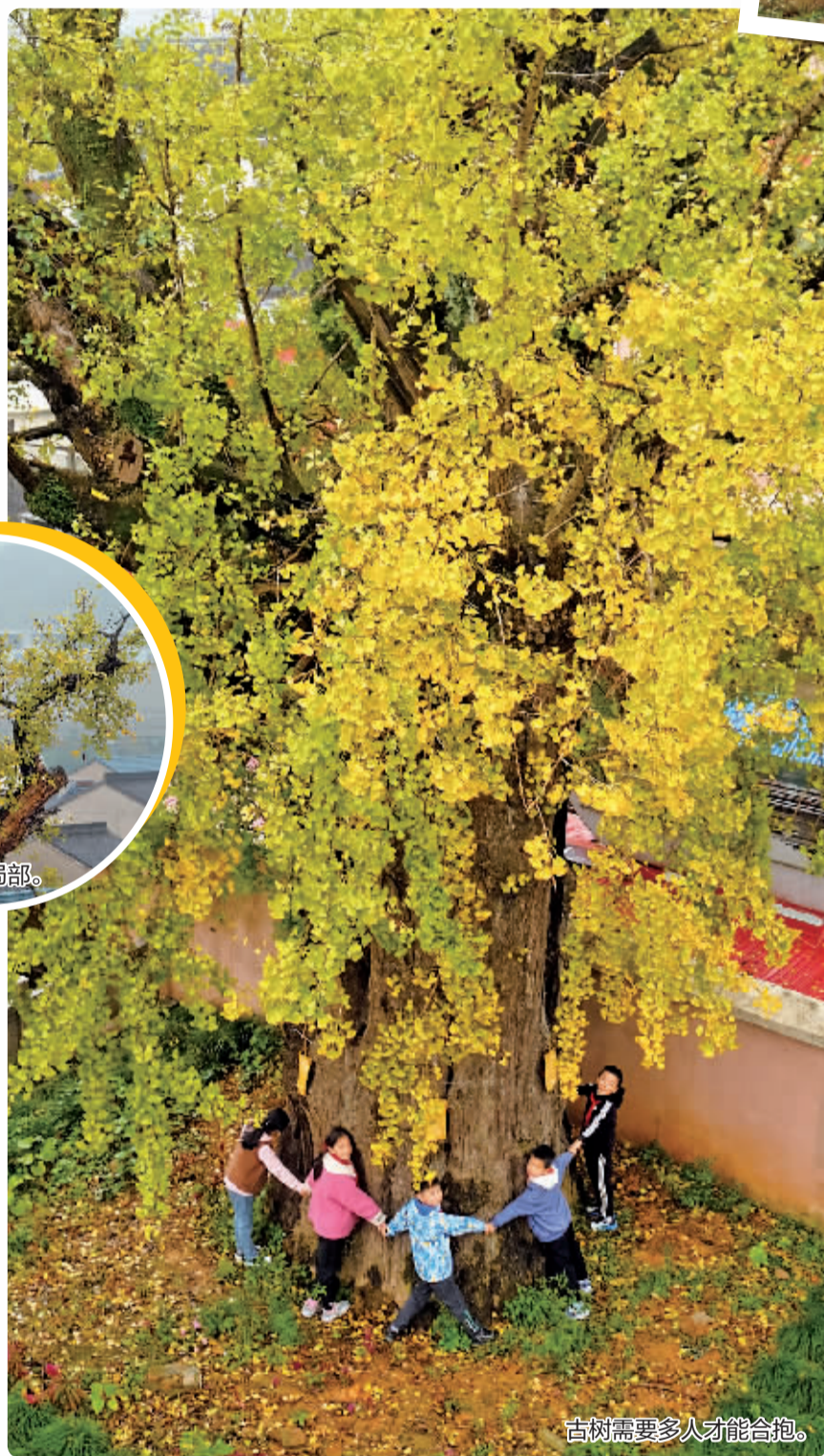
古树需要多人才能合抱。