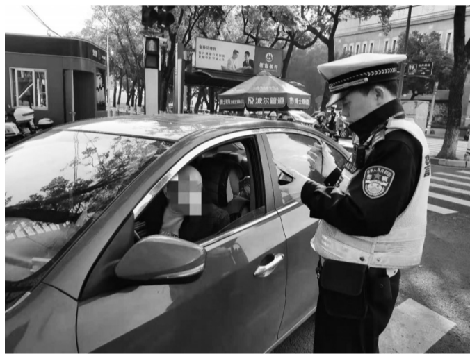
昨日,在海曙区镇明路与长春路路口,接连有驾驶员因开车使用手机被罚。

每年12月2日是“全国交通安全日”,今年的主题是知危险会避险,安全文明出行,借此时机,公安交警启动“文明开车我参与”,该活动将通过集中整治+宣传教育方式持续推进。除开车使用手机,接下来交警还会紧盯路面加塞、车窗抛物、违规鸣号等违法行为。