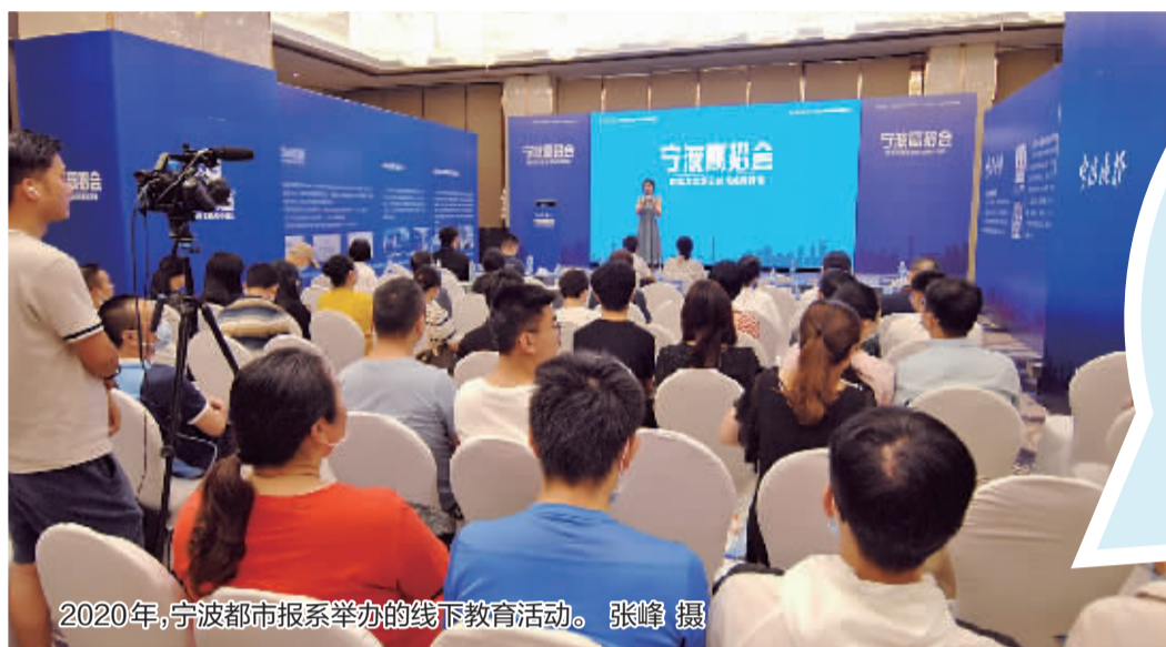
2020年,宁波都市报系举办的线下教育活动。