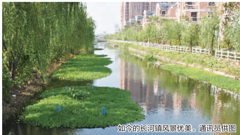
如今的长河镇风景优美。通讯员供图