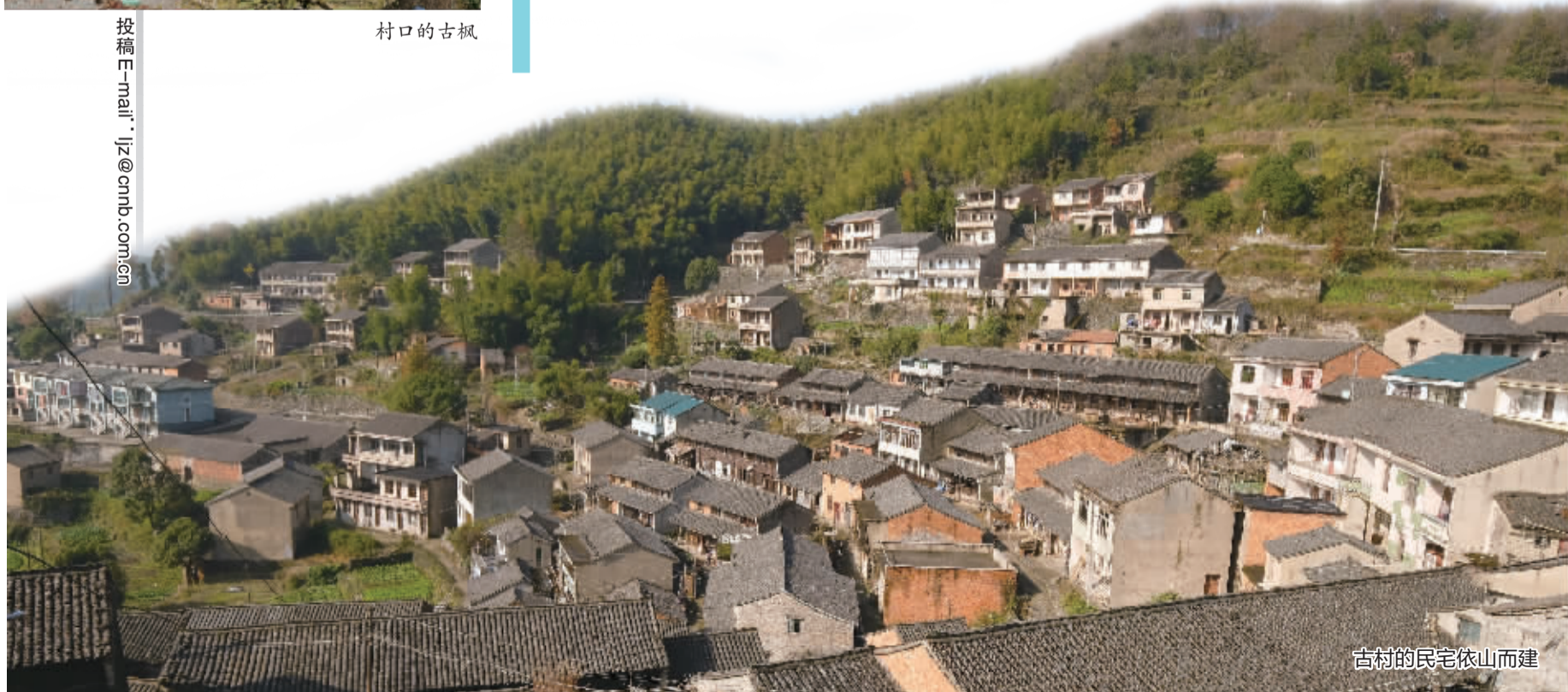
古村的民宅依山而建