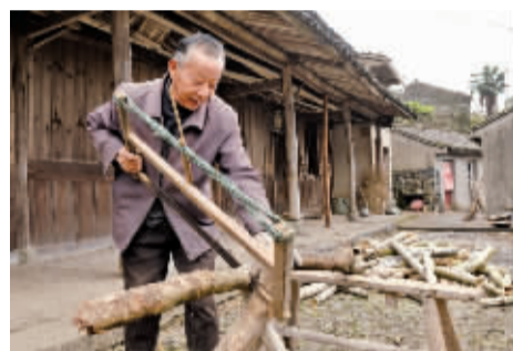
村民把废弃的树枝锯开当柴烧

上世纪六七十年代是金山古村鼎盛时期，村里有440多户人家，1400余人。过去，村民靠山吃山，因村里盛产毛竹、茶叶，于是竹器厂、麻纺厂、制茶厂等村办企业相继开办起来。如今，只能从旧址上窥见当年的繁荣。