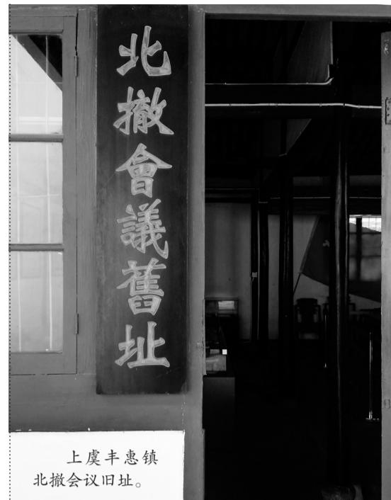
上虞丰惠镇北撤会议旧址。

正当北撤行动如期进行的时候,台风在悄无声息地步步逼近。据史料证实,当年名为“琴恩”的21号台风,于9月30日晚沿台湾海峡一路北上肆虐,路径怪异,最大风