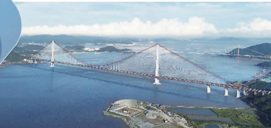
西岙门公铁大桥效果图。