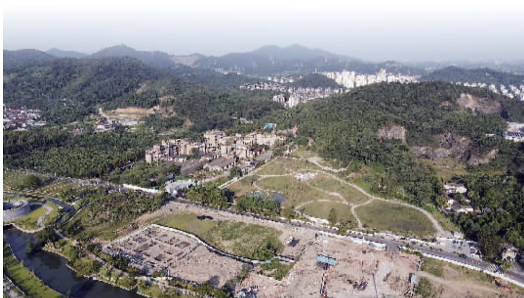
东门村遗址周边环境。

本报讯(记者 顾嘉懿 通讯员 王光远 丁风雅) 宁波考古界又传好消息!昨天,市文化遗产管理研究院公布了江北慈城东门村遗址考古发掘成果。