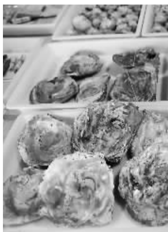
井头山遗址发掘的牡蛎和蚝。

出土遗存和所处地理环境表明河姆渡文化直接来源于宁波沿海地区,把余姚和宁波的人文历史轴线在河姆渡文化基础上向前延伸1000多年。