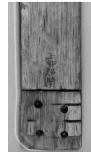
余姚花园新村汉六朝遗址出土的封检。

花园新村汉六朝遗址的考古发掘是浙江地区汉代基层聚落考古的重要收获,对于全面认识本地区汉文化具有重要意义。