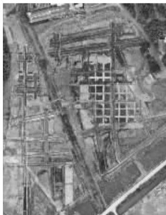
施岙遗址水稻田“井”字形道路系统。

施岙古稻田的发现,是浙江史前考古的重大发现。如此大规模的“井”字形结构的水田,目前在全国范围内仅见于浙江地区,起源年代有可能早至距今6000年以上,突破了学术界对史前时期水稻田的认识。古水田与自然淤积层的间隔,为研究人类生产与环境的变迁提供了新材料。