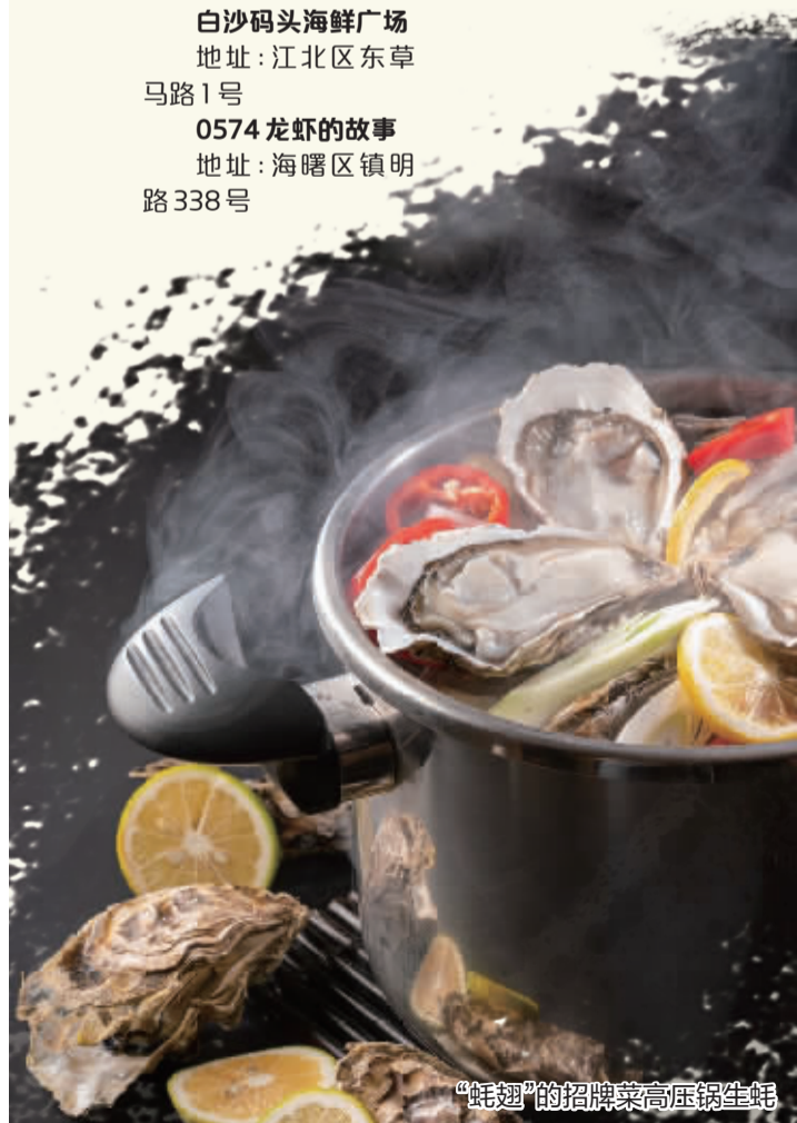
“蚝翅”的招牌菜高压锅生蚝