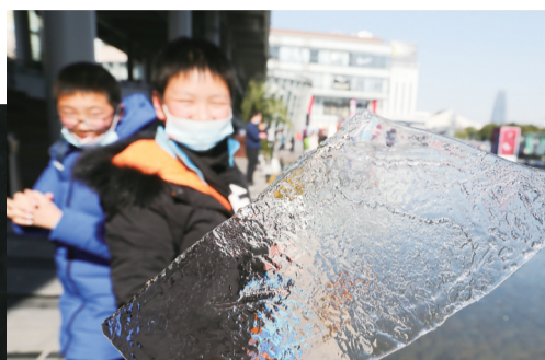
昨日,天一广场水晶街的水面上都结冰了,孩子们玩得可开心了。