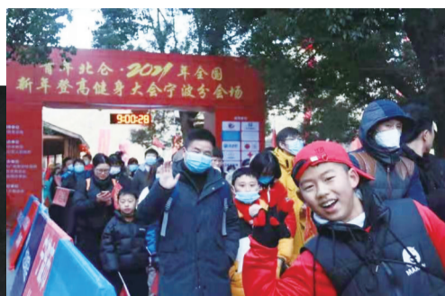
昨日上午,北仑九峰山。300多名登山爱好者登山迎新年。