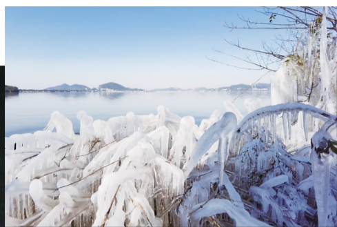
寒潮过后,东钱湖畔美丽冰景。