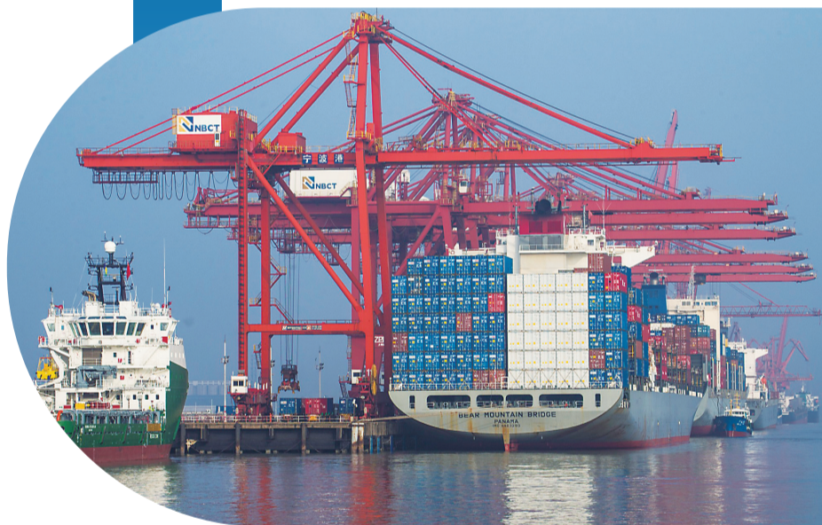
源源不绝的集装箱通过宁波舟山港联通世界。

时代出题,使命答卷。市委十三届八次全会确立了宁波当好浙江建设“重要窗口”模范生的使命任务,这与总书记对宁波的殷切期望是完全一致的,与省委对宁波提出的“四个走在前列”“四个实实在在”“交出四张高分答卷”的工作要求是完全相通的,也与宁波奋力推进“六争攻坚”、加快建设国际港口名城和东方文明之都的奋斗目标是完全同向的。