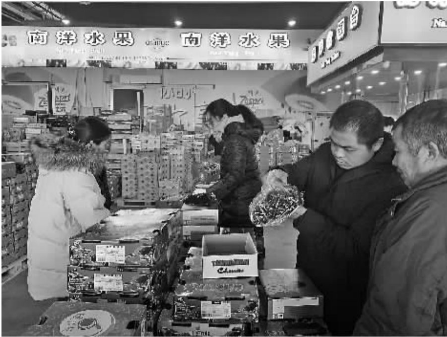
顾客在宁波果品批发市场挑选进口车厘子。

春节临近，甬城水果市场的“当红明星”非车厘子莫属。最近有财经媒体关于“车厘子价格腰斩”的话题瞬间发酵，冲上微博热搜第一位。昔日价格高贵的洋水果，在2021年春节来临前，真的便宜到“想吃就吃”的价位？记者对近期甬城的水果批发、零售市场进行了一番调查。