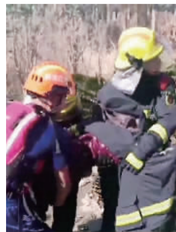
救援人员给老人换上千衣服后,抬离现场。

据救助老人的男子说,他是在附近钓鱼的,当时发现有一大团红色衣服在河面上漂浮,于是好奇地过去看了看,才发现是个人。于是他果断报警,同时脱掉衣服跳下水去将老人往岸上拖,直到民警、消防员赶到现场。“这个没什么,别人遇见了也会这么做的。”当消防员询问他的身份信息时,他没有回答就离开了。