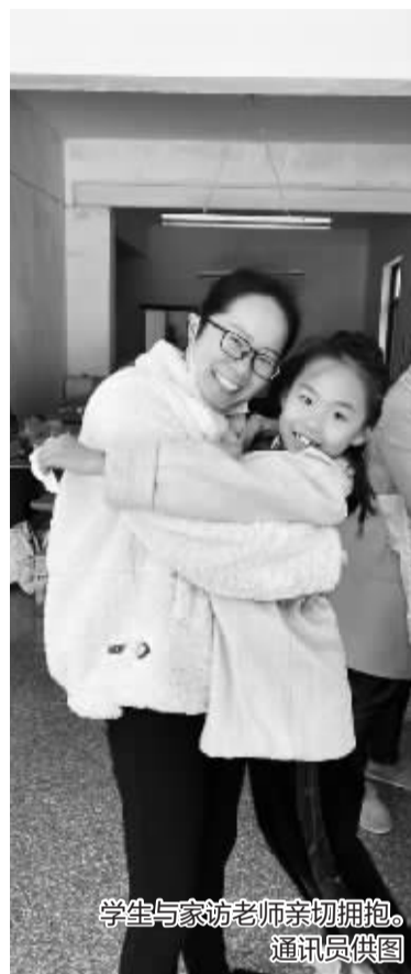
学生与家访老师亲切拥抱。