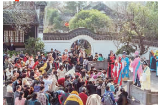
梁祝文化园内人头攒动。