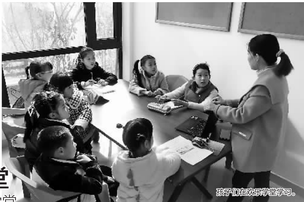
孩子们在欢乐学堂学习。

“你们知道怎么做灯笼吗?”元宵节快到了,在鄞州区银东社区汇悦湾一期小区里,有个小小的欢乐学堂坐满了小朋友,他们正在制作灯笼。寒假期间,这里成了孩子们的乐园。要说这欢乐学堂有什么特别的,这是一个由社区居民自发众筹的小课堂。