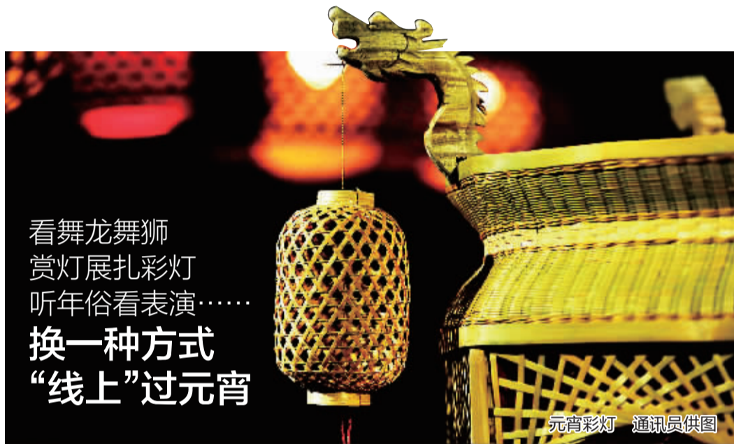
元宵彩灯

与此同时,今年还有不少甬菜餐厅、宁波老字号把正月十五少不了的这一碗汤圆纷纷搬上了外卖平台。记者在饿了么、美团等平台看到,缸鸭狗、老外婆、老宁波1381餐厅、糖糕甜品等,均有多款汤圆产品,可提供外卖服务,方便购买。