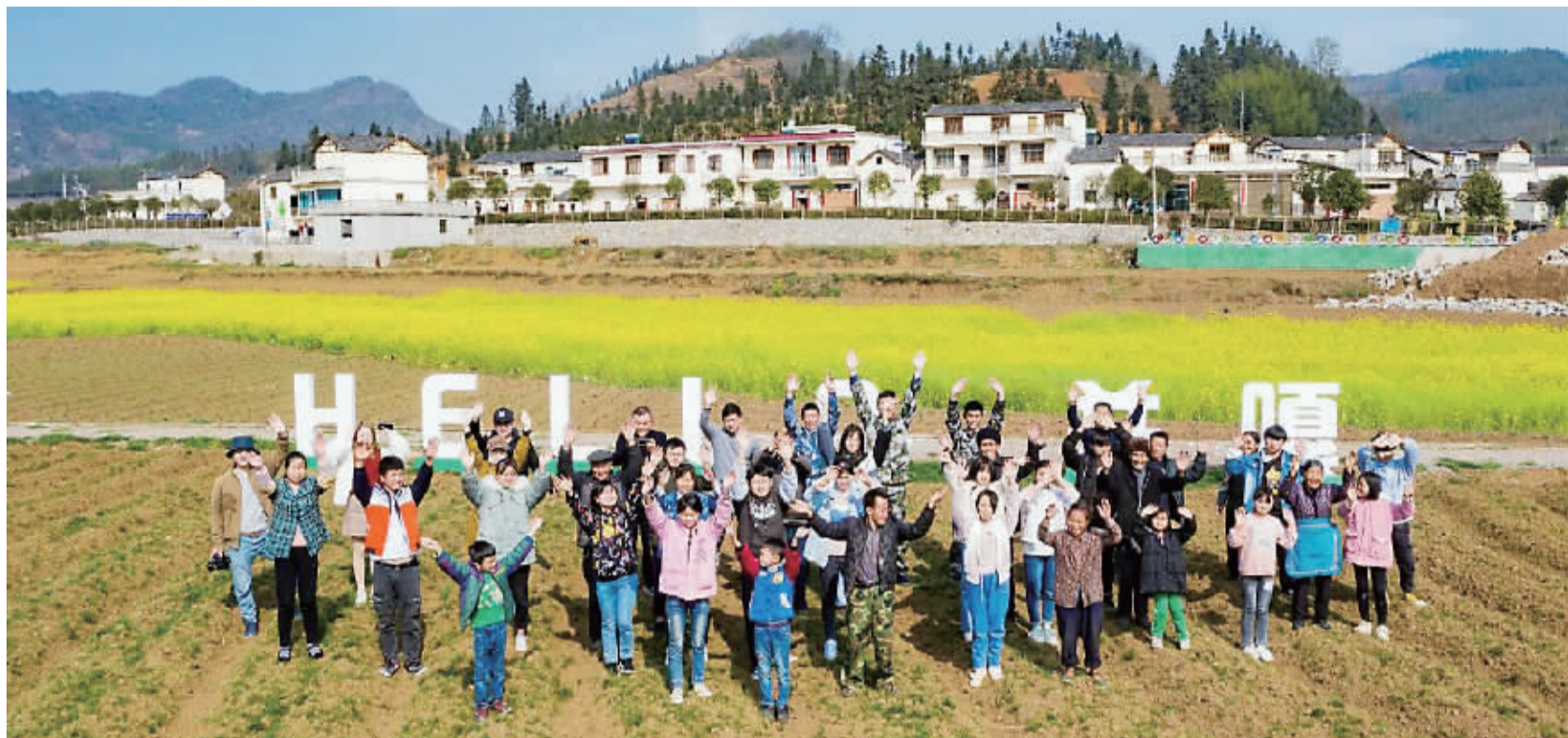
被帮助的困难学生在“花海基地”前邀请大家来并嘎村旅游