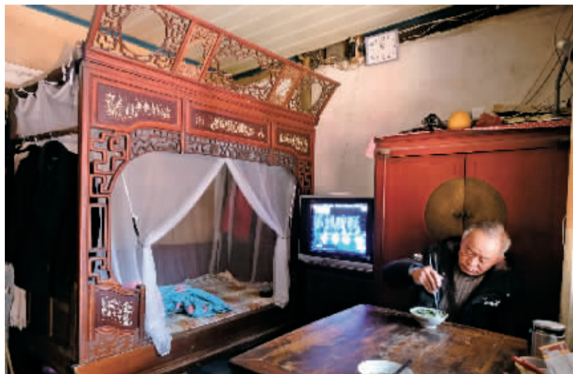
村民家里的老式家具