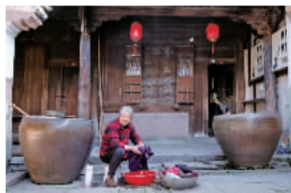
村民依旧延续着老派的生活习惯