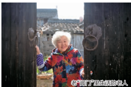
老“阊门”里生活的老人