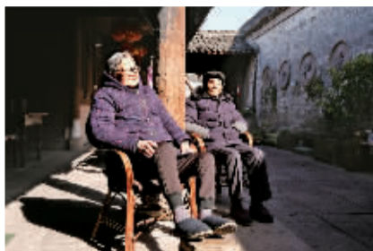
一对老伴在享受冬日的暖阳