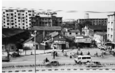
上世纪范宅和偃月街街口

之阁。此阁临湖，坐西朝东，内有木质楼梯可上，四面设窗，凭栏可眺望湖景。马衙街口原有虹桥一座，亦名感圣桥，为月湖七桥之一。桥改作路之后，桥形不显，逐渐为人淡忘。