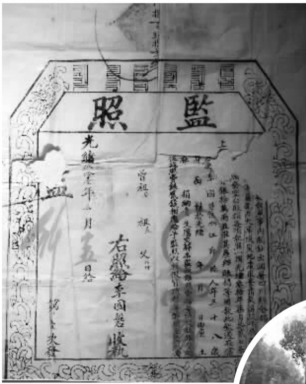
▲宁波教育博物馆珍藏的监照。