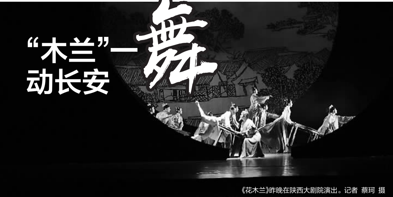
《花木兰》昨晚在陕西大剧院演出。记者 蔡珂 摄

4月1日、2日,宁波市歌舞剧院舞剧《花木兰》走进西安,为古都观众带去两场演出。今年3月,《花木兰》剧组从宁波出发,经南宁、长沙、重庆、成都抵达西安,一个月里连演10场,所到之处,引发“木兰风暴”。