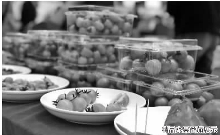
精品水果番茄展示