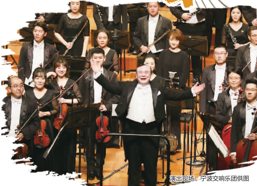
演出现场。宁波交响乐团供图