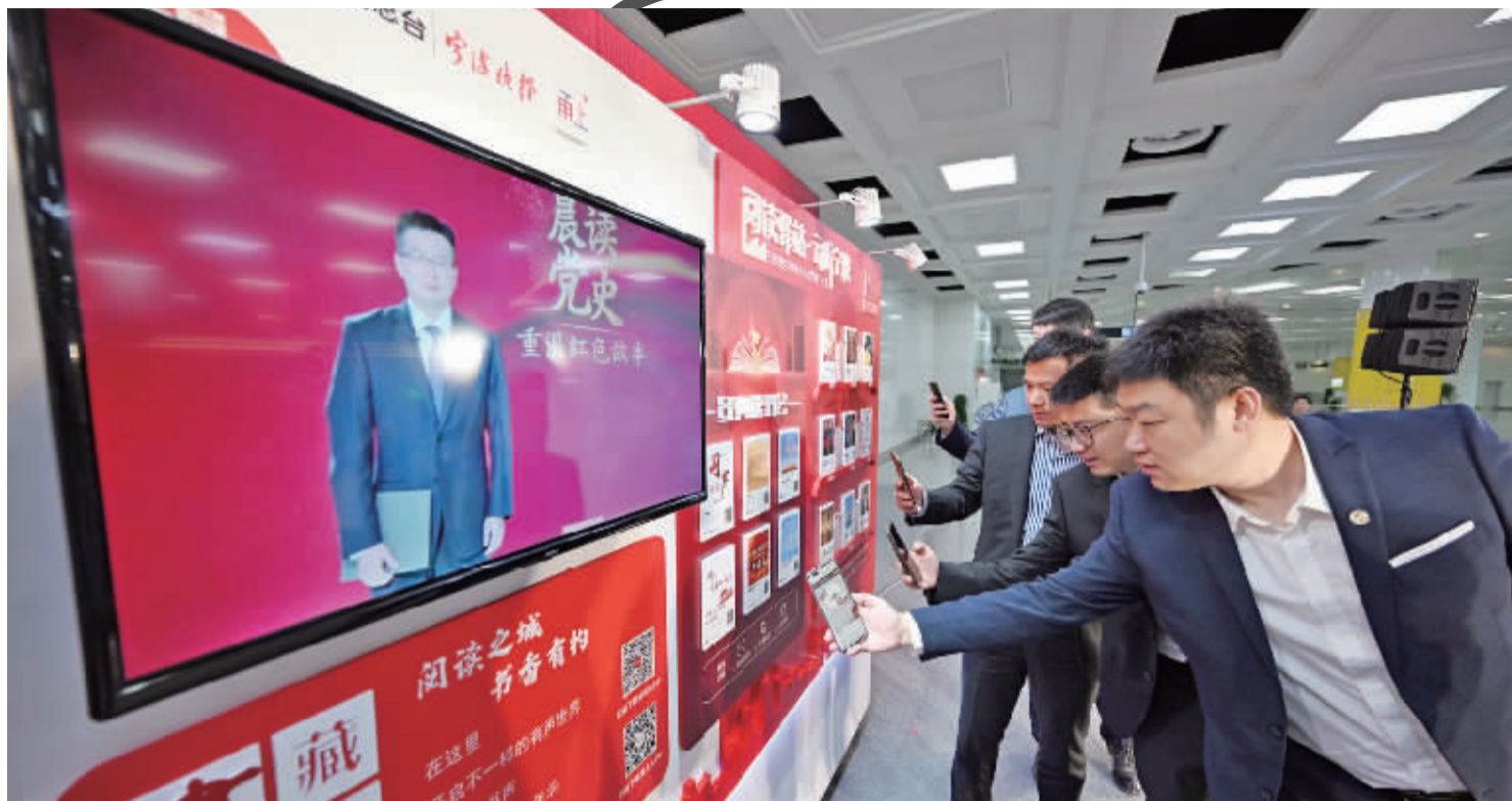
“云听”体验快捷方便。