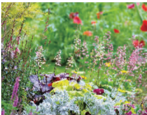
改造后的花园成了一道靓丽的风景。