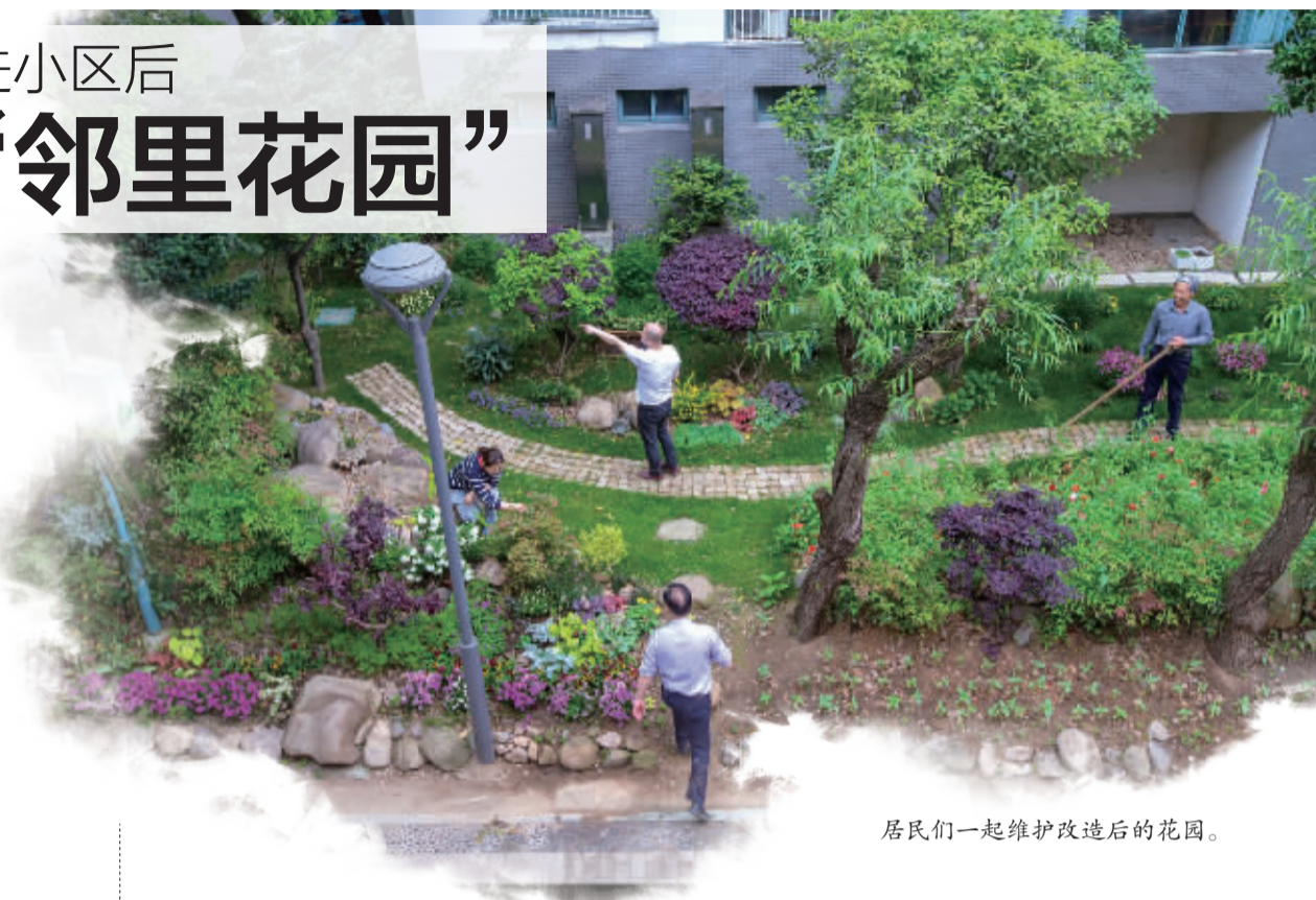
居民们一起维护改造后的花园。