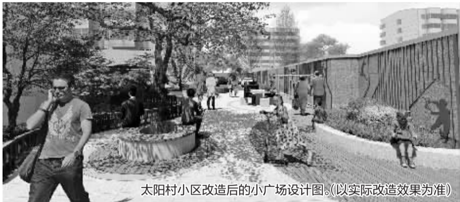
太阳村小区改造后的小广场设计图。(以实际改造效果为准)

昨天上午，记者从江北区住建局获悉，随着近日施工单位提交开工报告并进场施工，外滩街道的太阳村小区和玛瑙小区正式启动老旧小区改造，这也是江北区今年率先启动改造的两个老小区。据介绍，今年江北区计划改造老旧小区28个，涉及住户1.77万户，计划在今年年底完工。